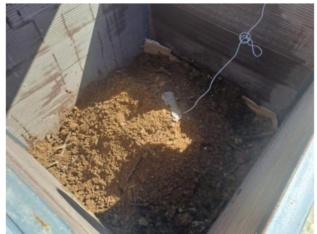
Fig 2. Serena town HOA, 20 July 2023 Серена таун СӨХ, 2023 оны 7-р сарын 20