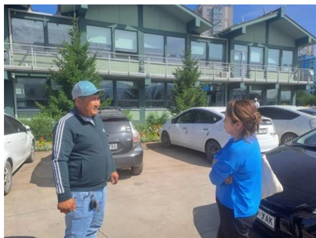
Fig 3. National garden park, 20 July 2023 Үндэсний цэцэрлэгт хүрээлэн, 2023 оны 7-р сарын 20