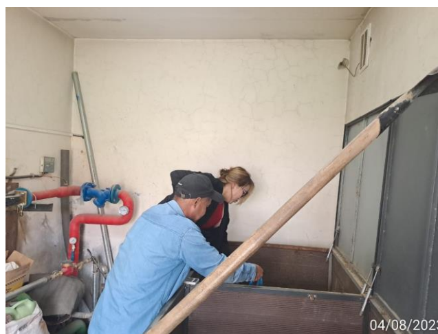
Fig 3. School 67, 4 August 2023 67-р сургууль дээр, 2023 оны 8-р сарын 4