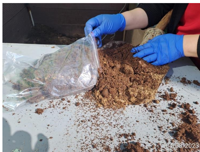
Fig 2. Kindergarten 80, 4 August 2023 80-р цэцэрлэг дээр, 2023 оны 8-р сарын 4