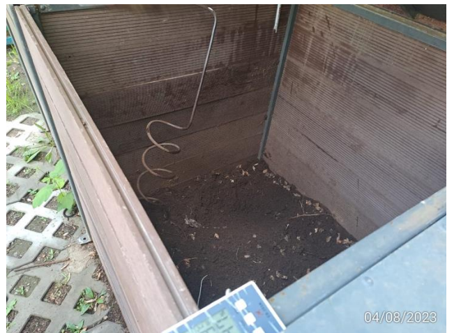
Fig 1. Kindergarten 136, 04 August 2023 136-р цэцэрлэг дээр, 2023 оны 8-р сарын 04