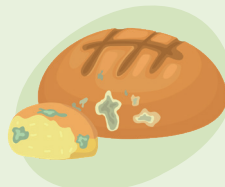
Талх, нарийн боовны үлдэгдэл