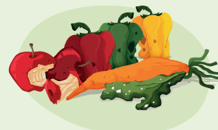
Жимс, ногооны үлдэгдэл