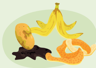
Төмс, хүнсний ногоо, жимсний хальс

Компост хийхэд хүнсний дараах хаягдлуудыг ашиглаж болно.