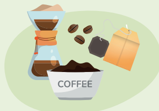
Цай, кофены шаар